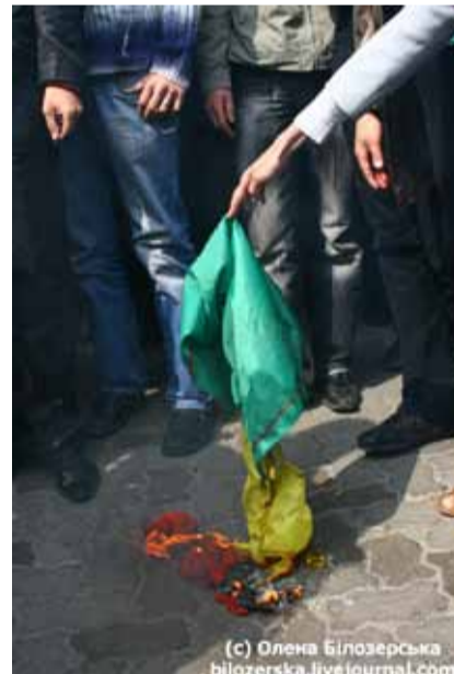
НА ФОТО: Ватажок наці-скінхедів демонструє зграї що потрібно робити з прапорами, які він вважає прапорами Ефіопії. На історичний батьківщині націонал-соціалізму за подібний вчинок передбачене ув'язнення.

Як і минулого року, ВО "Свобода" не дозволила наркоманам провести свій марш, та і по великому рахунку, акцію як таку. Виглядав "марш свободи" жалюгідно - кілька десятків учасників, затиснутих у невеликий майданчик біля УНІАНу. Постояли вони годинку - та й розбіглися дрібними перебіжками. Загалом - провал "маршу свободи" повний. Після помпезних перших "маршів" ця акція минулого року наштотувалась вже не на стихійний спротив правих активістів, а на організовану протидію "Свободи", яка крім прямого блокування "маршу" також здатна перемогти інформаційно та юридично. Як результат - акція різко пішла на спад і цього року вже була відверто провальною. Цілком можливо, що це була остання подібна акція "за легалайз".