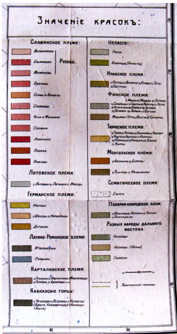
Фрагмент етнографічної карти слов'янства (таблиця умовних позначень)