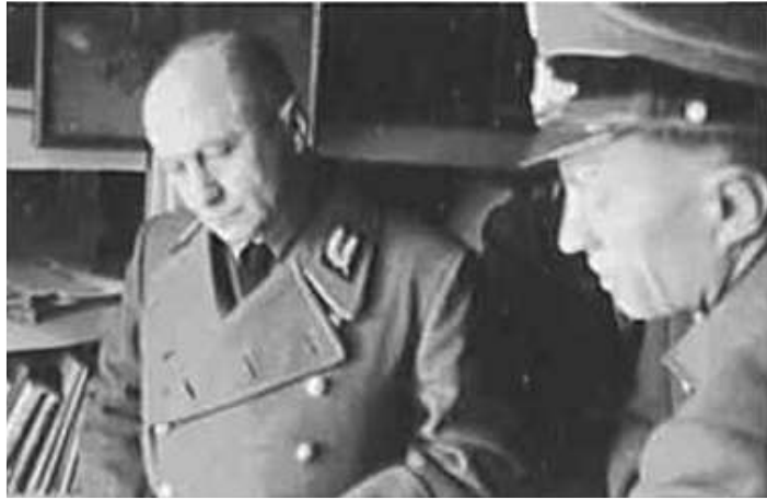
24. Генеральний комісар Білорусії гауляйтер В. Кубе під час візиту до служби Оперативного штабу у Мінську. Фото ГРГ "Остланд" (О. Нерлінг). Мінськ, 1 грудня 1942 р.

ЦДАВО України, ф. 3676, оп. 1, стр. 139, арк. 28, п. 26.