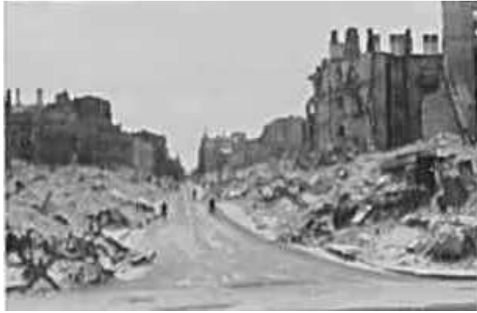
92. Київ, на розі Хрещатика та вул. Прорізної. 6–12 листопада 1942 р. ЦДАВО України, ф. 3676, оп. 1, спр. 139, арк. 20, п. 18.