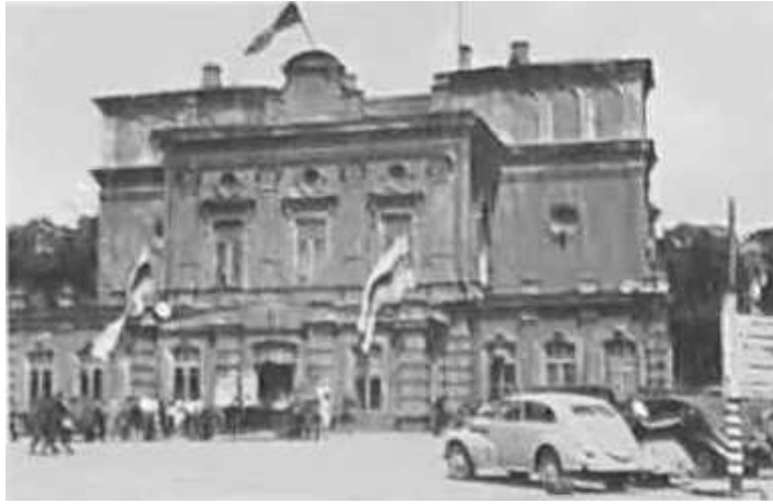
122. Мінськ, Білоруський державний театр (зараз Національний академічний театр імені Янки Купали).

червень 1943 р.