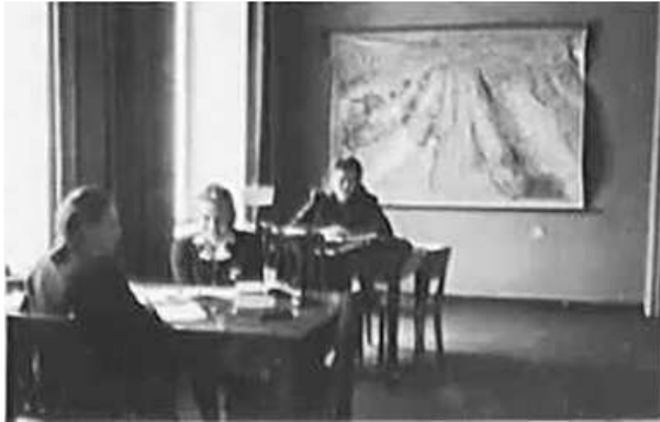
40. Дерпт, співробітниця Штабу за роботою у приміщенні його місцевого підрозділу. Фото ГРГ "Остланд" ([О. Нерлінг]), 20–21 січня 1943 р.

ЦДАВО України, ф. 3676, оп. 1, стр. 139, арк. 54, п. 25.