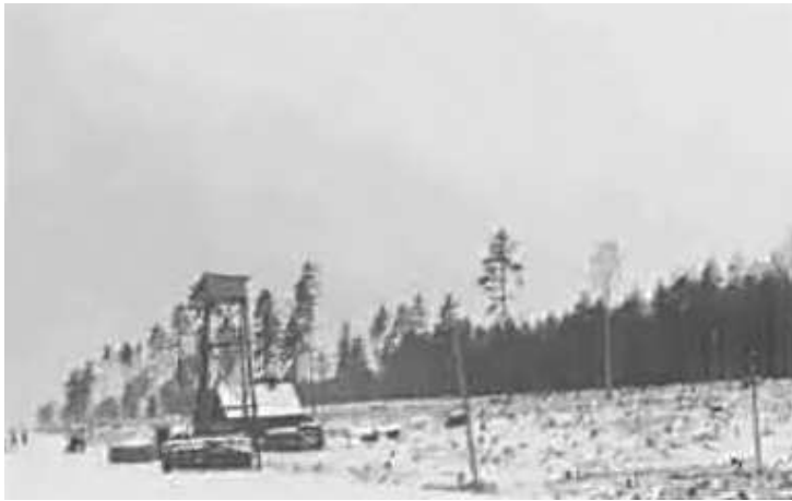
56. Спостережна вежа та опорний пункт охорони автостради “Мінськ–Смоленськ” від нападів партизан. 3–4 грудня 1942 р. ЦДАВО України, ф. 3676, оп. 1, спр. 139, арк. 48, п. 3.