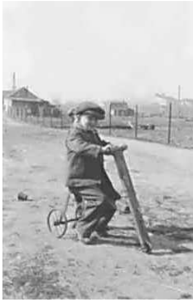
79. В Мінську. березень 1943 р. ЦДАВО України, ф. 3676, оп. 1, спр. 139, арк. 68, п. 4.