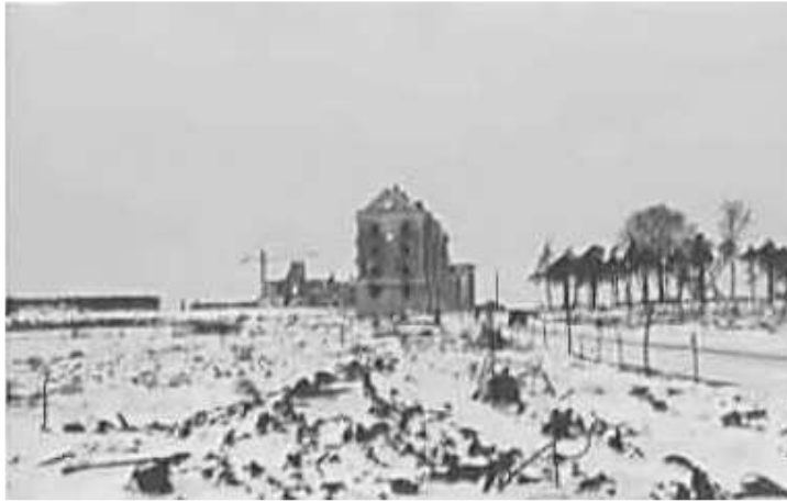
118. Мінськ, на Альтенбургерштрассе (Altenburgstrasse) (зараз вул. Козлова)

3–4 грудня 1942 р.