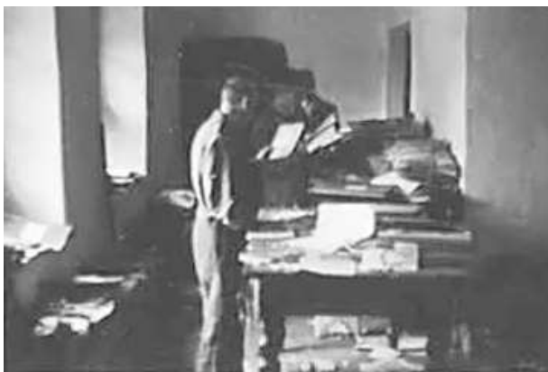
53. Упорядкування документів ВКП(б), вивезених Оперативним штабом зі Смоленська. [Вільно], червень 1943 р. ЦДАВО України, ф. 3676, оп. 1, спр. 139, арк. 78, п. 10.