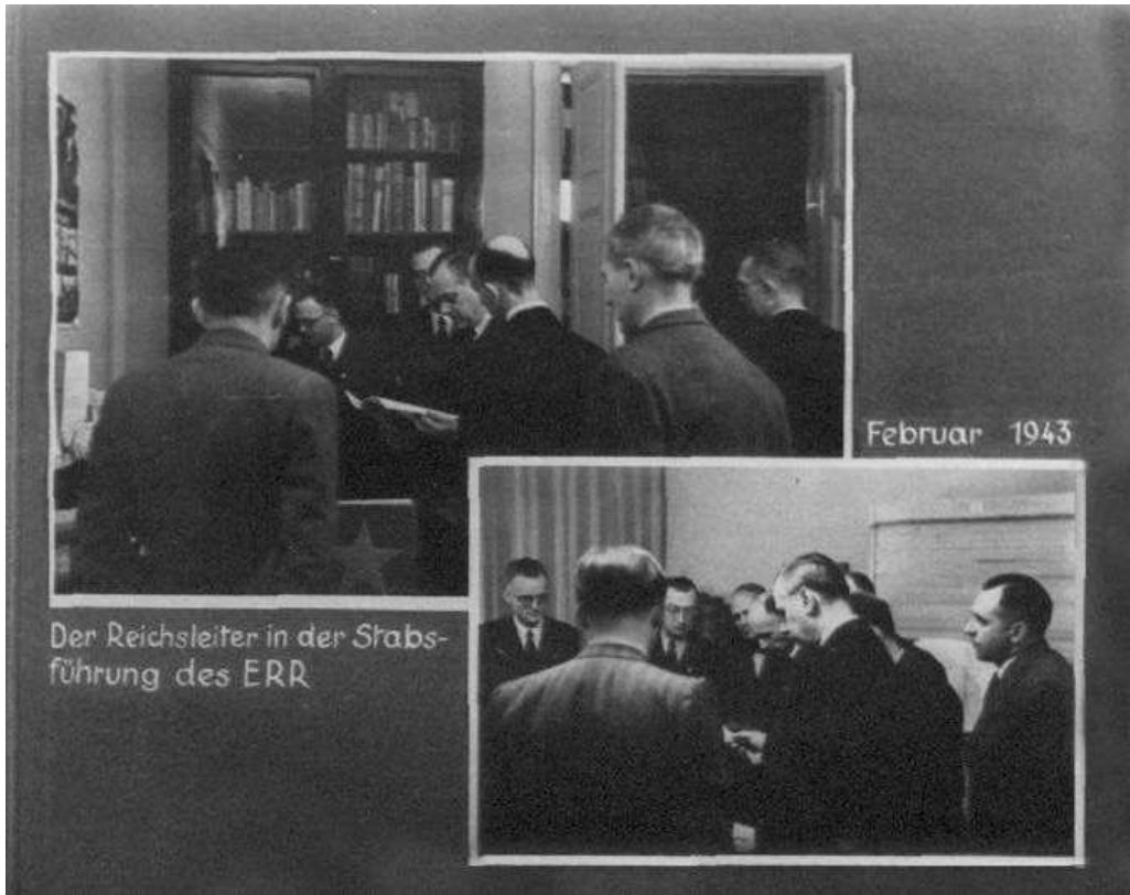
3. Фотографії офіційного візиту А. Розенберга (в центрі фотографії ліворуч, з брошурою в руках) до Управління штабу на Маргаретенштрассе. На фотографії два написи: "Райхсляйтер в Управлінні ОШР" (зліва) та "Лютий 1943 р." (справа). Берлін, Управління штабу, лютий 1943 р.