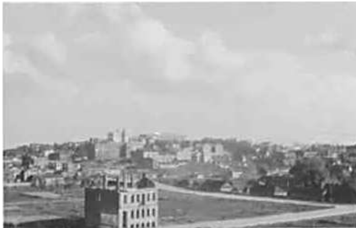
121. Мінськ, панорама міста з даху Оперного театру.

ЦДАВО України, ф. 3676, оп. 1, спр. 139, арк. 58, п. 10.