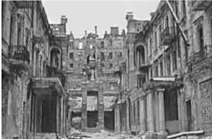
90. Київ, Хрещатик (Хрещатик, 34, т. зв. Малий пасаж або пасаж Ждановського). Зараз біля цього місця знаходиться арка адміністративної будівлі, що поєднана з будівлею Київської міської ради).

6–12 листопада 1942 р.