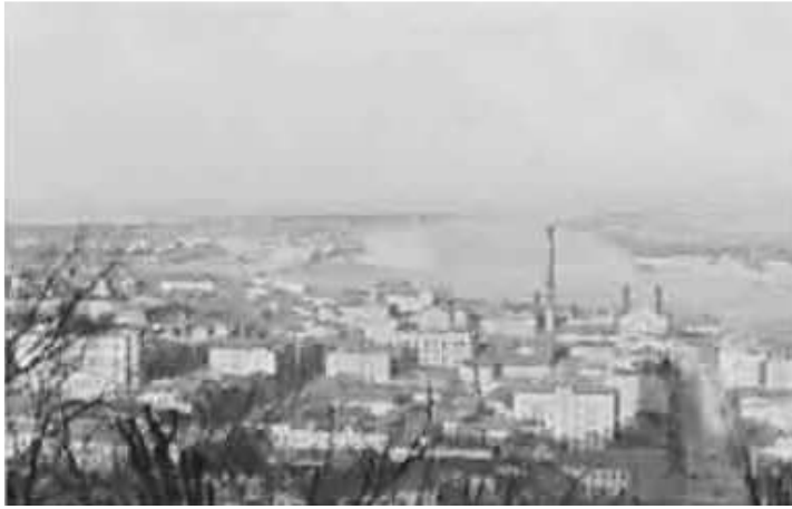
102. Київ, вид з високого правого берега Дніпра на Поділ. листопад 1942 р. ЦДАВО України, ф. 3676, оп. 1, спр. 139, арк. 31, п. 29.