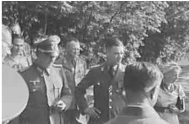
31. Співробітники Штабу під час відвідування сільськогосподарської дослідної станції у селі Лошиця (з 1985 р. включене до території м. Мінська). Фото ГРГ “Остланд” (Майєр), червень 1943 р.

ЦДАВО України, ф. 3676, оп. 1, спр. 139, арк. 58, п. 20.