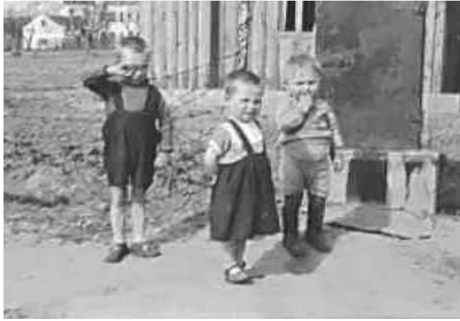
78. В Мінську. Фото ГРГ “Остланд” (Вальтер), березень 1943 р. ЦДАВО України, ф. 3676, оп. 1, спр. 139, арк. 68, п. 3.