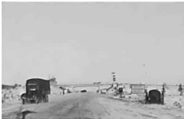
55. По дорозі з Мінська до Смоленська. Фото ГРГ “Остланд” (О. Нерлінг), 1–2 грудня 1942 р. ЦДАВО України, ф. 3676, оп. 1, стр. 139, арк. 44, п. 35.