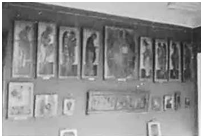
16. Зібрання ікон у Художньому музеї Харкова. Фото ГРГ “Остланд” (О. Нерлінг), Харків, 6–12 листопада 1942 р. ЦДАВО України, ф. 3676, оп. 1, спр. 139, арк. 24, п. 36.