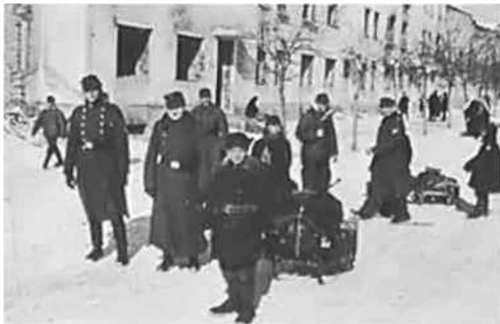
73. В Могильові. березень 1943 р. ЦДАВО України, ф. 3676, оп. 1, стр. 139, арк. 76, п. 16.