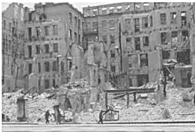
87. Київ, Хрещатик (під час окупації – вул. ім. Айхгорна (Eichhornstraße)). Фото ГРГ “Остланд” ([О. Нерлінг]), 6–12 листопада 1942 р. ЦДАВО України, ф. 3676, оп. 1, спр. 139, арк. 20, п. 3.