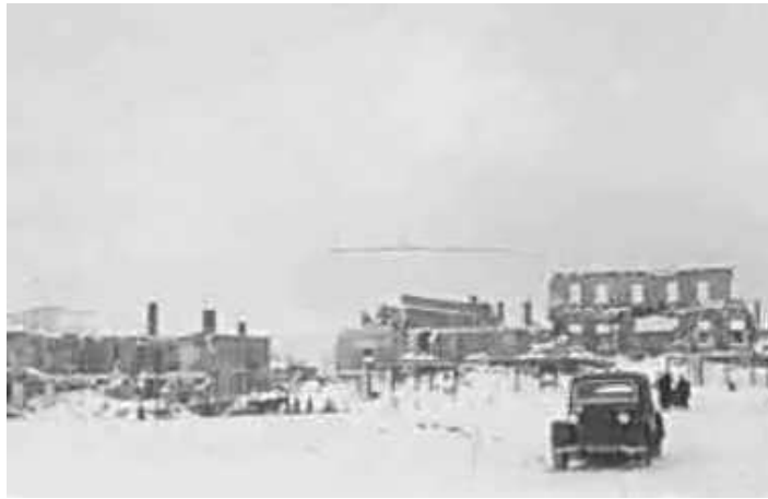
116. Мінськ. Фото ГРГ “Остланд” (О. Нерлінг), 1–2 грудня 1942 р. ЦДАВО України, ф. 3676, оп. 1, спр. 139, арк. 28, п. 10.