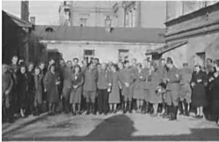
12. Групова фотографія учасників засідання керівників підрозділів Оперативного штабу. [Київ, 6–12 листопада 1942 р.] ЦДАВО України, ф. 3676, оп. 1, спр. 139, арк. 31, п. 14.