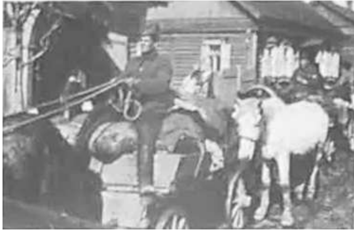
76. Транспортна [продовольча] колона. Фото ГРГ "Остланд" (Вальтер), Могильов, березень 1943 р. ЦДАВО України, ф. 3676, оп. 1, спр. 139, арк. 76, п. 36.