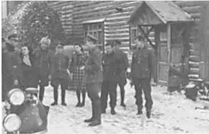
19. Від'їзд співробітників служби Штабу у Смоленську. Фото ГРГ “Остланд” (О. Нерлінг), 2–3 грудня 1942 р. ЦДАВО України, ф. 3676, оп. 1, спр. 139, арк. 46, п. 21.