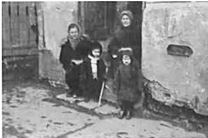
71. В Могильові. Фото ГРГ “Остланд” (Вальтер), березень 1943 р. ЦДАВО України, ф. 3676, оп. 1, спр. 139, арк. 18, п. 33.