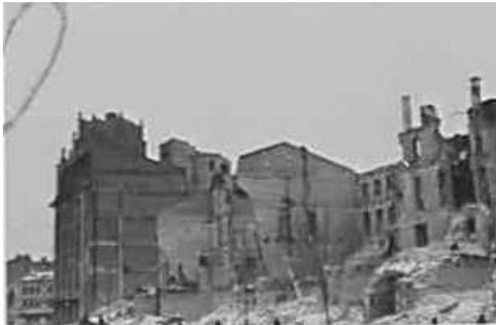
99. Київ, Хрещатик. Фото ГРГ “Остланд” ([О. Нерлінг]), 6–12 листопада 1942 р. ЦДАВО України, ф. 3676, оп. 1, спр. 139, арк. 20, п. 34.