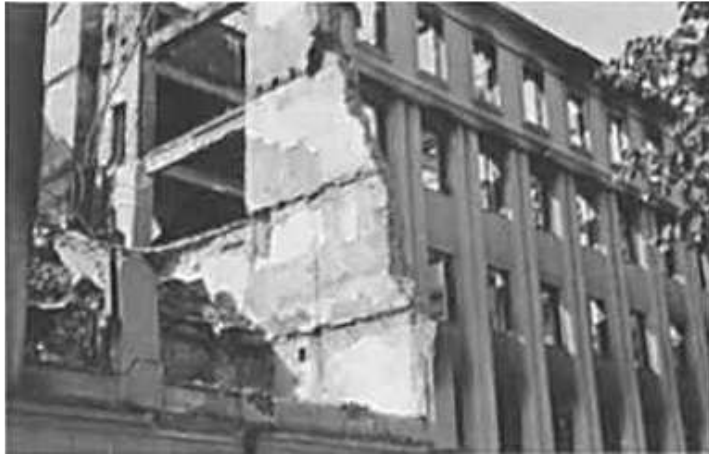
120. Мінськ, зруйнована будівля фельдкомендатури на Коммантантурштрассе (зараз у цій будівлі розташований філологічний факультет Білоруського державного університету за адресою вул. Карла Маркса, 31).

червень 1943 р.