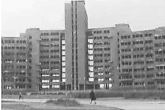
107. Харків, Будинок Державної промисловості. Фото ГРГ “Остланд” ([О. Нерлінг]), 6–12 листопада 1942 р. ЦДАВО України, ф. 3676, оп. 1, спр. 139, арк. 22, п. 12 а.