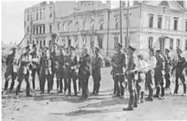
29. Мінськ, учасники засідання Управління Штабу, присвяченого питанням окупованих східних територій, на прогулянці містом. Фото ГРГ "Остланд" (О. Нерлінг), червень 1943 р. ЦДАВО України, ф. 3676, оп. 1, стр. 139, арк. 58, п. 7.