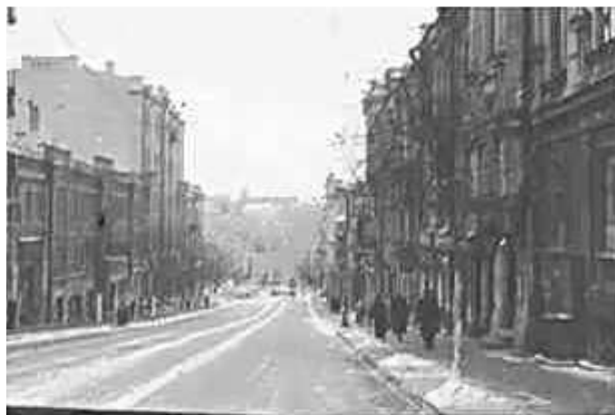
86. Київ, вул. Прорізна. 6–7 листопада 1942 р. ЦДАВО України, ф. 3676, оп. 1, спр. 139, арк. 10, п. 1.