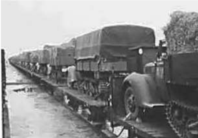
63. Німецька транспортна колона під Вітебськом. Фото ГРГ “Остланд” (Майєр), лютий–березень 1943 р. ЦДАВО України, ф. 3676, оп. 1, спр. 139, арк. 8, п. 17.