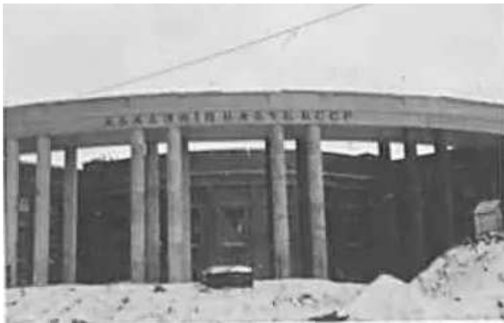
115. Мінськ, будівля АН БРСР.

ЦДАВО України, ф. 3676, оп. 1, спр. 139, арк. 44, п. 5.