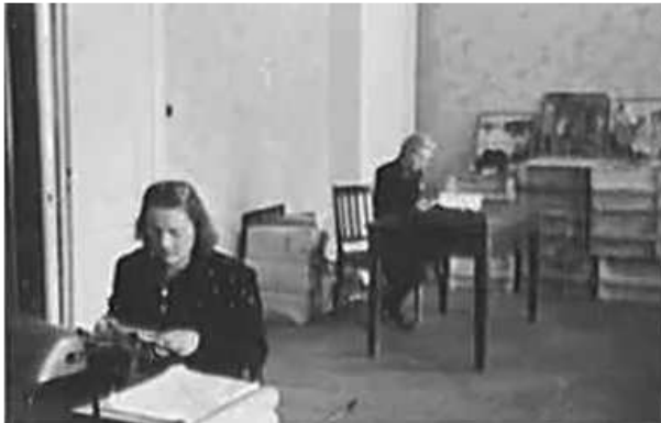
41. Дерпт, співробітниця Штабу за роботою у приміщенні його місцевого підрозділу. Фото ГРГ "Остланд" ([О. Нерлінг]), 20–21 січня 1943 р.

ЦДАВО України, ф. 3676, оп. 1, стр. 139, арк. 54, п. 25.