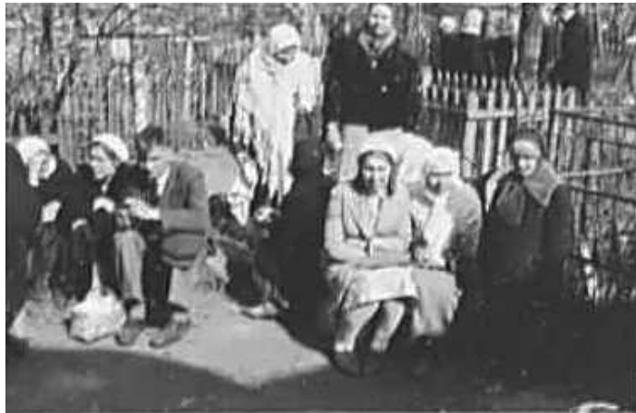
81. Натовп перед церквою з нагоди Великодня. Мінськ, [25 квітня] 1943 р. ЦДАВО України, ф. 3676, оп. 1, спр. 139, арк. 68, п. 7.