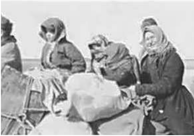
68. Біженці з-під Ржева. Фото ГРГ “Остланд” (Вальтер), Могильов, березень 1943 р. ЦДАВО України, ф. 3676, оп. 1, стр. 139, арк. 18, п. 12.