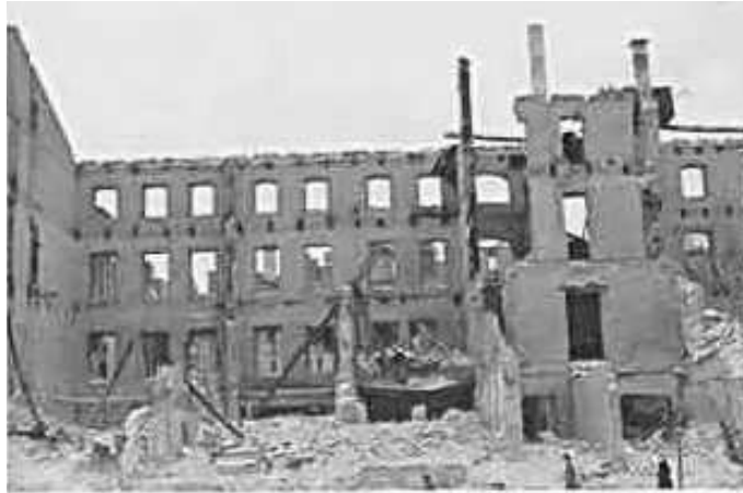
89. Київ, Хрещатик. Фото ГРГ “Остланд” ([О. Нерлінг]), 6–12 листопада 1942 р. ЦДАВО України, ф. 3676, оп. 1, спр. 139, арк. 20, п. 10.