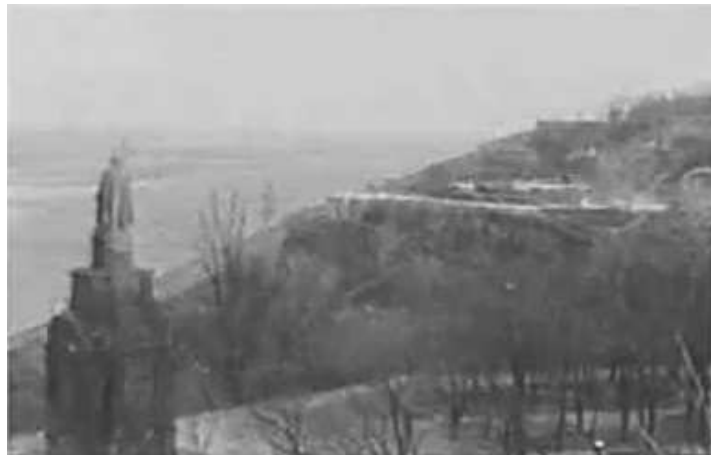
103. Київ, пам’ятник Св. Володимиру на Володимирській гірці. Панорама лівого берега Дніпра з верхньої площадки парку “Володимирська гірка”. [Фото ГРГ “Остланд” (О. Нерлінг)], листопад 1942 р. ЦДАВО України, ф. 3676, оп. 1, спр. 139, арк. 31, п. 33.