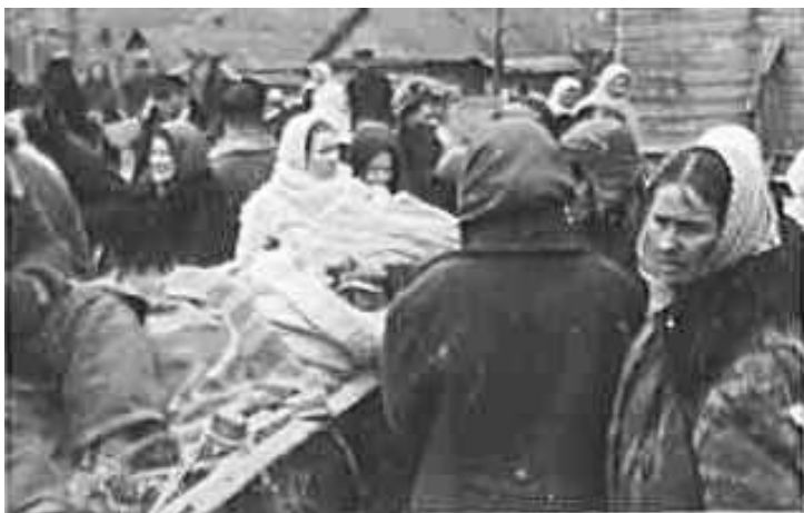
64. Могильов, базарний день. Фото ГРГ “Остланд” (Майер), лютий–березень 1943 р. ЦДАВО України, ф. 3676, оп. 1, спр. 139, арк. 8, п. 28.