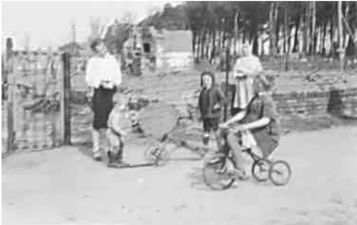
77. Діти бавляться на вулиці. Фото ГРГ "Остланд" (Вальтер), Мінськ, березень 1943 р. ЦДАВО України, ф. 3676, оп. 1, спр. 139, арк. 68, п. 2.