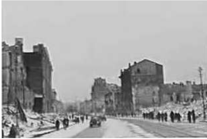
98. Київ, Хрещатик. Фото ГРГ “Остланд” ([О. Нерлінг]), 6–12 листопада 1942 р. ЦДАВО України, ф. 3676, оп. 1, спр. 139, арк. 20, п. 33.