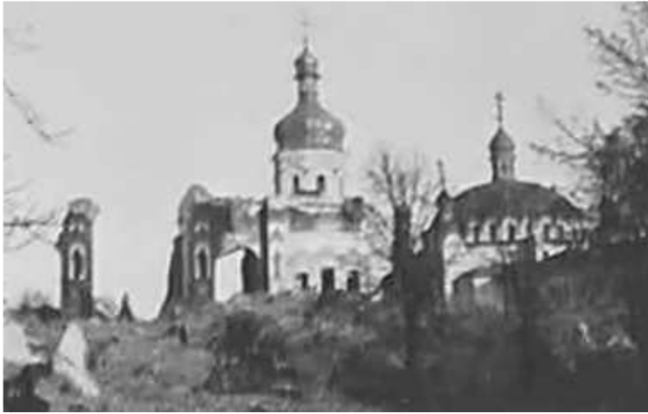
104. Київ, Києво-Печерська лавра, руїни Успенського собору.

листопад 1942 р.