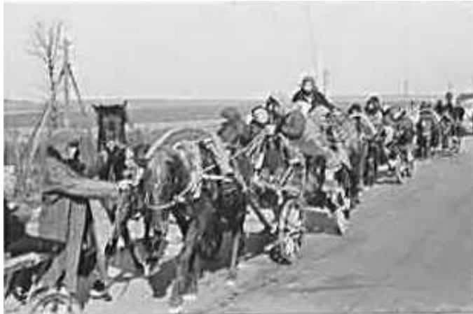
67. Колона біженців з-під Ржева поблизу Могильова. Фото ГРГ “Остланд” (Вальтер), березень 1943 р. ЦДАВО України, ф. 3676, оп. 1, спр. 139, арк. 18, п. 9.