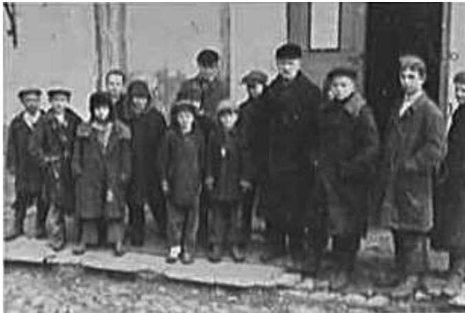
69. Могильов, місцевий архівіст зі школярами. березень 1943 р. ЦДАВО України, ф. 3676, оп. 1, стр. 139, арк. 18, п. 19.