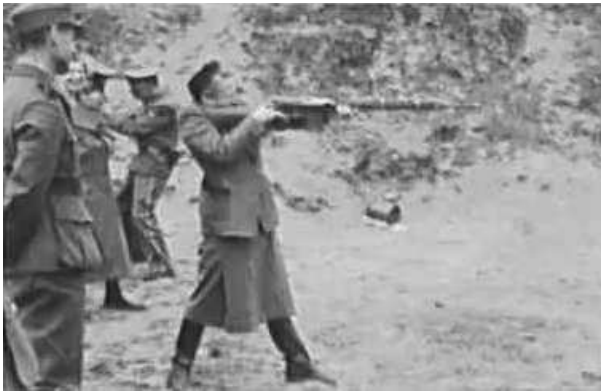
33. Співробітники Оперативного штабу на стрільбищі. Фото ГРГ “Остланд” (Вальтер), Мінськ, березень 1943 р. ЦДАВО України, ф. 3676, оп. 1, спр. 139, арк. 68, п. 27.