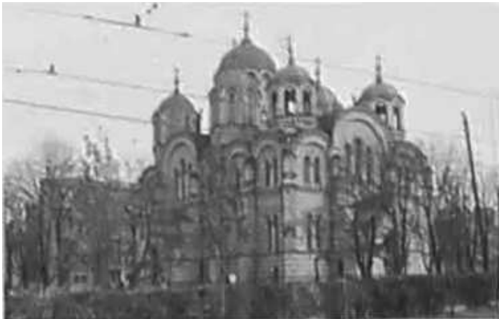
105. Київ, Володимирський собор.

ЦДАВО України, ф. 3676, оп. 1, спр. 139, арк. 31 зв., п. 39.