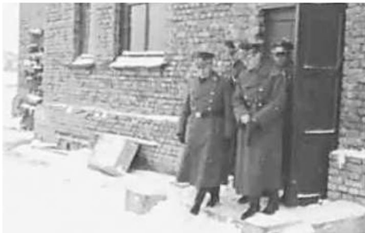
25. Генеральний комісар Білорусії, гауляйтер В. Кубе (на передньому плані зліва) у супроводі О. Нерлінга, керівника ГРГ "Остланд", Г. Крафта, керівника РГ "Білорусія", В. Янецке, міського комісара Мінська. Фото ГРГ "Остланд", 1 грудня 1942 р.

ЦДАВО України, ф. 3676, оп. 1, стр. 139, арк. 28, п. 26.