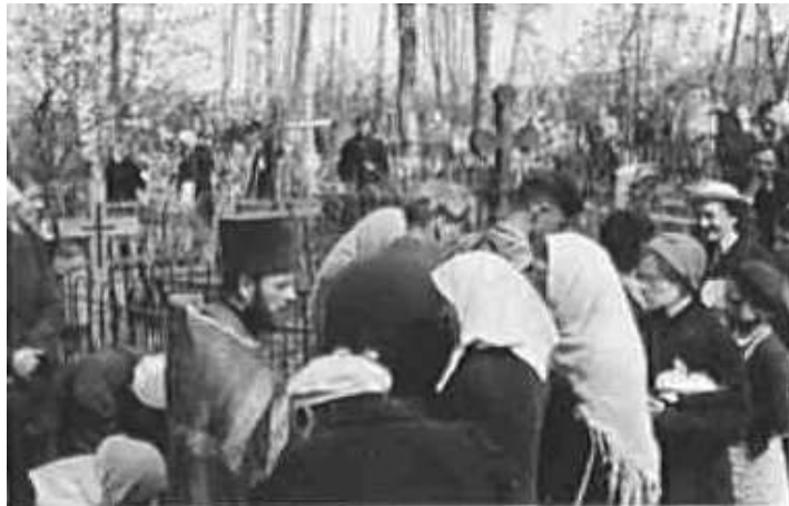
83. На кладовищі біля церкви після богослужіння з нагоди Великодня. Фото ГРГ “Остланд” (Вальтер), Мінськ, [25 квітня] 1943 р. ЦДАВО України, ф. 3676, оп. 1, стр. 139, арк. 68, п. 17.