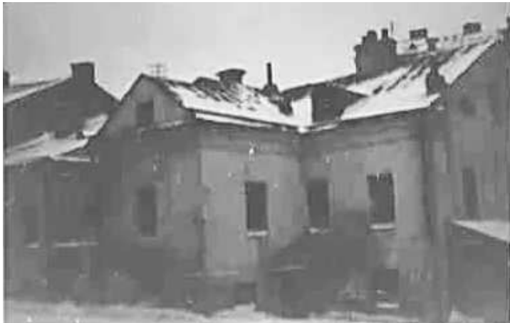
119. Мінськ, імовірно, флігель Єврейського педагогічного технікуму (зараз вул. Вітебська, 11) 3 . Фото ГРГ “Остланд”

ЦДАВО України, ф. 3676, оп. 1, спр. 139, арк. 48, п. 13.