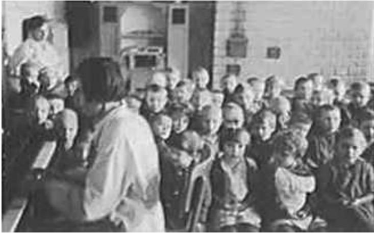
72. У дитячому садочку. Могильов, березень 1943 р. ЦДАВО України, ф. 3676, оп. 1, стр. 139, арк. 18, п. 39.