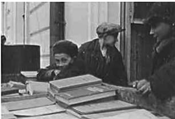
35. Могильов, переміщення книжкових зібрань 2 .

ЦДАВО України, ф. 3676, оп. 1, спр. 139, арк. 33, п. 13.