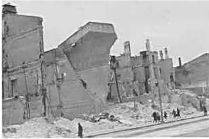
88. Київ, Хрещатик. Фото ГРГ “Остланд” ([О. Нерлінг]), 6–12 листопада 1942 р. ЦДАВО України, ф. 3676, оп. 1, спр. 139, арк. 20, п. 9.