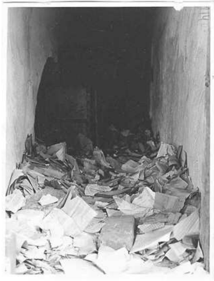
6. Вхід до архівосховища Статистичного управління УРСР. Київ, вул. Короленка, 24 (зараз вул. Володимирська), липень 1942 р.

ЦДАВО України, ф. 3206, оп. 5, спр. 1, арк. 214. Опубл.: Себта Т. Фонди магнатських архівів та судово-адміністративних установ КЦАДА у контексті взаємних претензій Рейхскомісаріату України та Генерал-губернаторства Польщі / Т. Себта, Н. Черкаська // Архіви України. – 2003. – № 4–6. – С. 204.