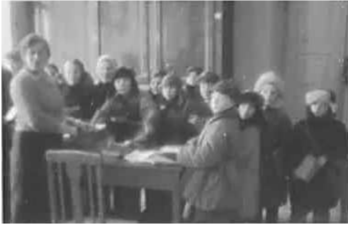
62. Горки, видача книг в місцевій бібліотеці. січень 1943 р. ЦДАВО України, ф. 3676, оп. 1, спр. 139, арк. 33, п. 23.