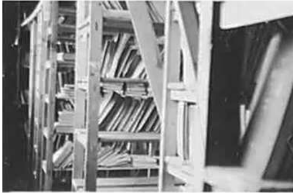
28. Мінськ, в одному з робочих приміщень місцевого підрозділу Оперативного штабу. Фото ГРГ "Остланд" (О. Нерлінг), грудень 1942 р. ЦДАВО України, ф. 3676, оп. 1, стр. 139, арк. 44, п. 25.