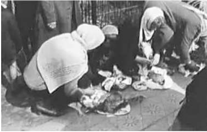
82. На кладовищі біля церкви після богослужіння з нагоди Великодня. Мінськ, [25 квітня] 1943 р. ЦДАВО України, ф. 3676, оп. 1, стр. 139, арк. 68, п. 15.