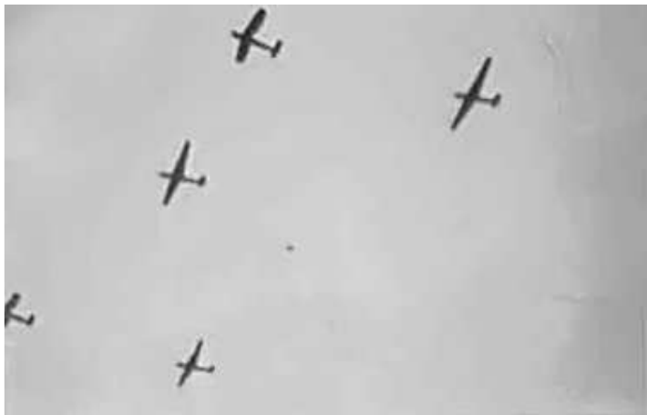
57. Літаки із планерами в небі над Ригою. 25 жовтня 1942 р. – 29 січня 1943 р. ЦДАВО України, ф. 3676, оп. 1, спр. 139, арк. 42, п. 26.