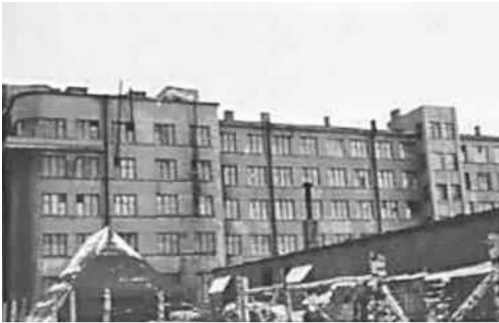
123. Смоленськ, колишня будівля ДПУ на вул. Дзержинського (зараз будівля УМВС Росії в Смоленській області на вул. Дзержинського, 13).

ЦДАВО України, ф. 3676, оп. 1, спр. 139, арк. 58, п. 33.