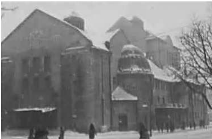
129. Ревель, Естонський драматичний театр (ест.: Eesti Draamateater). Фото ГРГ "Остланд" (О. Нерлінг), 17–18 січня 1943 р. ЦДАВО України, ф. 3676, оп. 1, спр. 139, арк. 38, п. 31.