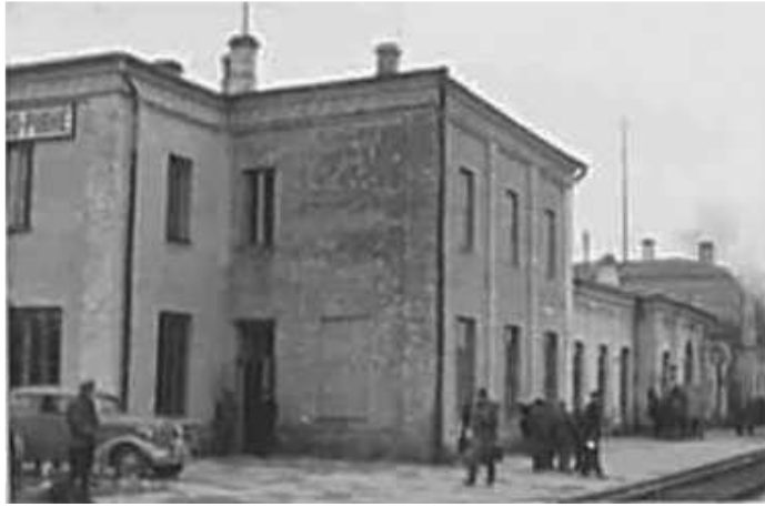
106. Рівне, залізничний вокзал. Фото ГРГ “Остланд” ([О. Нерлінг]), 6–12 листопада 1942 р. ЦДАВО України, ф. 3676, оп. 1, спр. 139, арк. 35, п. 17.