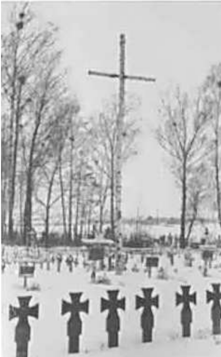
58. Могильов, німецьке солдатське кладовище. січень 1943 р.

ЦДАВО України, ф. 3676, оп. 1, стр. 139, арк. 33, п. 4.