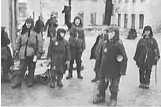
66. В Могильові. лютий–березень 1943 р. ЦДАВО України, ф. 3676, оп. 1, спр. 139, арк. 66, п. 19.