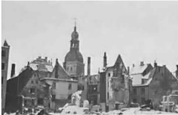
127. Рига, Домська площа (в центрі – руїни Домського собору). Фото ГРГ “Остланд” (О. Нерлінг), 5–16 січня 1943 р. ЦДАВО України, ф. 3676, оп. 1, спр. 139, арк. 56, п. 16.