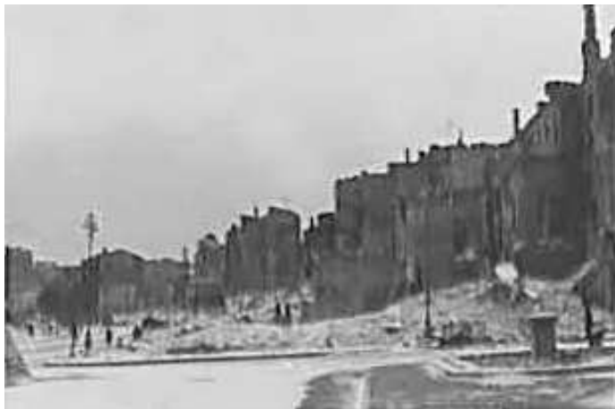
95. Київ, Хрещатик. 6–12 листопада 1942 р. ЦДАВО України, ф. 3676, оп. 1, спр. 139, арк. 20, п. 26.