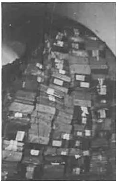
52. Матеріали ВКП(б), вивезені Оперативним штабом зі Смоленська. Фото ГРГ “Остланд” (Майер), [Вільно], червень 1943 р. ЦДАВО України, ф. 3676, оп. 1, спр. 139, арк. 78, п. 11.