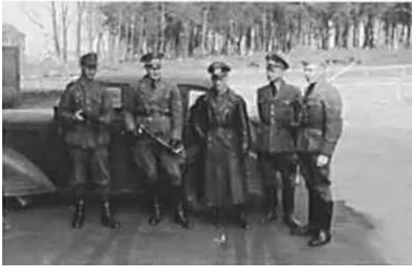
32. Співробітники Оперативного штабу на стрільбищі. Фото ГРГ “Остланд” (Вальтер), Мінськ, березень 1943 р. ЦДАВО України, ф. 3676, оп. 1, спр. 139, арк. 68, п. 23.