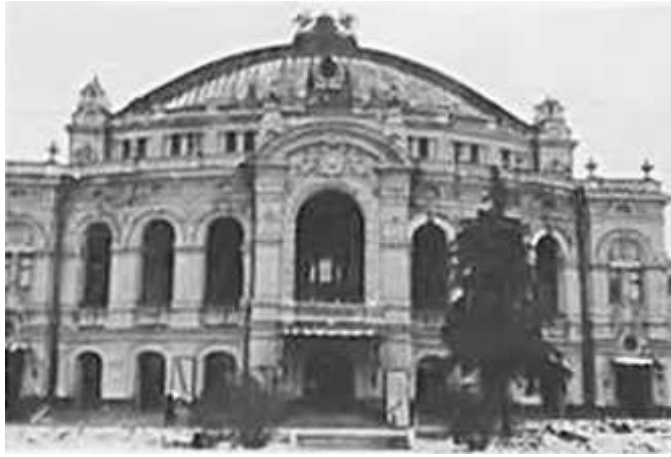
100. Київ, будівля Київського академічного театру опери і балету ім. Т. Шевченка (зараз Національна опера України) на вул. Короленка (зараз вул. Володимирська). Фото ГРГ “Остланд” ([О. Нерлінг]), 6–12 листопада 1942 р. ЦДАВО України, ф. 3676, оп. 1, спр. 139, арк. 20 зв., п. 39.