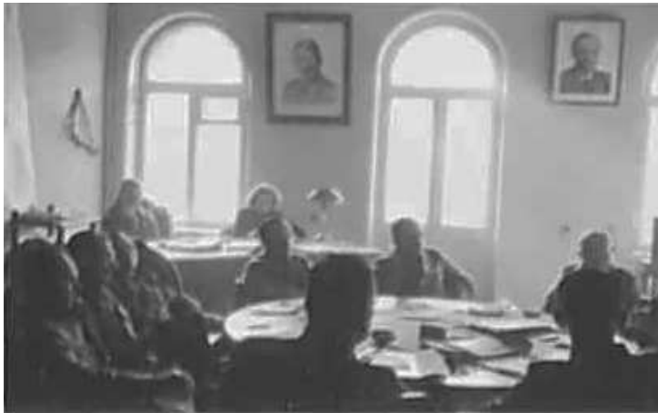
11. Засідання керівників підрозділів Оперативного штабу з питань окупованих східних територій. Фото ГРГ “Остланд”, Київ, [6–12 листопада 1942 р.] ЦДАВО України, ф. 3676, оп. 1, спр. 139, арк. 35 зв., п. 38.