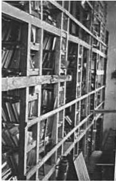
27. Мінськ, у сховищі Державної бібліотеки ім. В. І. Леніна.

ЦДАВО України, ф. 3676, оп. 1, стр. 139, арк. 28, п. 29.