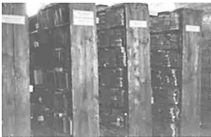
17. В одному з робочих приміщень служби Оперативного штабу в Смоленську. Фото ГРГ “Остланд” (О. Нерлінг), Смоленськ, 2–3 грудня 1942 р. ЦДАВО України, ф. 3676, оп. 1, спр. 139, арк. 46, п. 5.