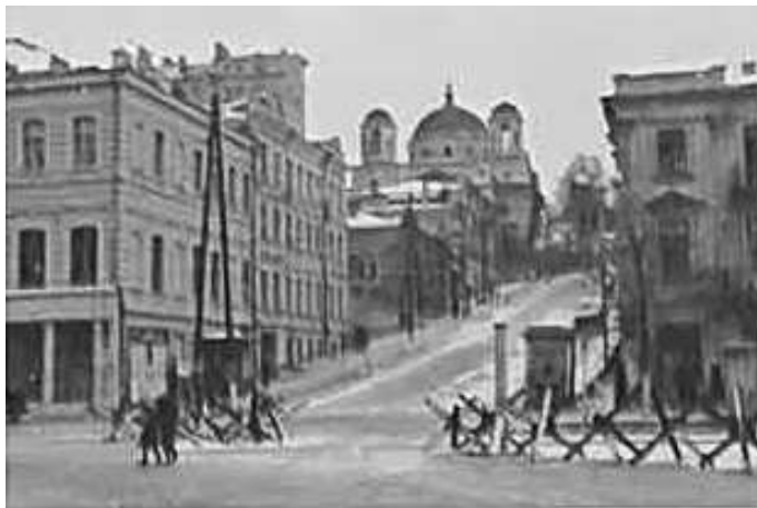
97. Київ, вид з тогочасної площі III Інтернаціоналу на вул. Жертв революції (зараз вул. Трьохсвятительська) та костел Св. Олександра. Фото ГРГ “Остланд” ([О. Нерлінг]), 6–12 листопада 1942 р.

ЦДАВО України, ф. 3676, оп. 1, спр. 139, арк. 20, п. 29.