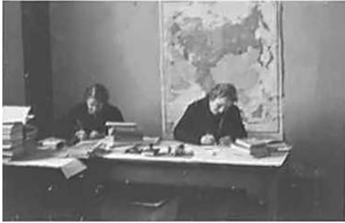
18. Співробітниці Штабу за роботою в Смоленську. Фото ГРГ “Остланд” (О. Нерлінг), 2–3 грудня 1942 р. ЦДАВО України, ф. 3676, оп. 1, спр. 139, арк. 46, п. 7.