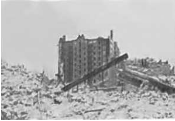
94. Київ, Хрещатик, руїни т. зв. Будинку Гінзбурга, на той час найвищої будівлі УРСР (зараз на цьому місці розташований готель “Україна”). 6–12 листопада 1942 р. ЦДАВО України, ф. 3676, оп. 1, спр. 139, арк. 20, п. 24.