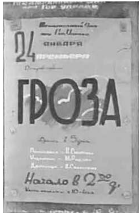
59. Могильов, афіша місцевого театру. січень 1943 р.

ЦДАВО України, ф. 3676, оп. 1, стр. 139, арк. 33, п. 4.