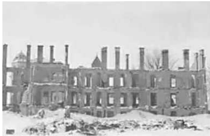
117. Мінськ. Фото ГРГ “Остланд” (О. Нерлінг), 1–2 грудня 1942 р. ЦДАВО України, ф. 3676, оп. 1, спр. 139, арк. 28, п. 17.