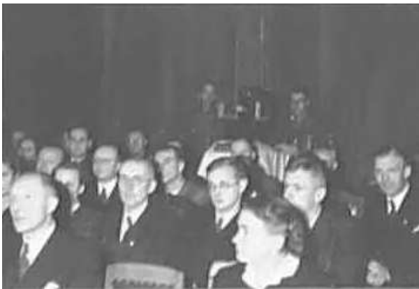
43. Офіційний прийом при ГРГ “Остланд” для військовослужбовців і представників цивільної адміністрації, т. зв. “відкритий вечір”. Під час виголошення доповіді на тему політики та ідеології. Фото ГРГ “Остланд” (О. Нерлінг), Рига, 5–16 січня 1943 р.

ЦДАВО України, ф. 3676, оп. 1, спр. 139, арк. 54, п. 27.