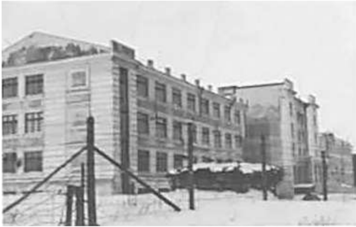
114. Мінськ, [Політехнічний інститут] (в оригінальній підтекстівці до позитиву фотографії вказано: “Будинок техніки”).

1–2 грудня 1942 р.