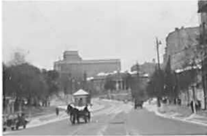
96. Київ, вул. Кірова (за часів окупації – вулиця ім. д-ра Тодта (Dr. Todtstraße), зараз вул. М. Грушевського). Фотографія зроблена з місця сучасної Європейської площі (до війни – площа III Інтернаціоналу, за часів окупації – площа ім. Гітлера (Hitlerplatz) в бік Будинку Ради народних комісарів УРСР (зараз будівля Кабінету Міністрів України) та Державного музею українського мистецтва (зараз Національний художній музей України). Фото ГРГ “Остланд” ([О. Нерлінг]), 6–12 листопада 1942 р.

ЦДАВО України, ф. 3676, оп. 1, спр. 139, арк. 20, п. 29.