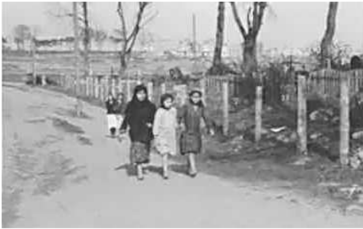
80. На шляху до церкви на Великдень. Фото ГРГ "Остланд" (Вальтер), Мінськ, [25 квітня] 1943 р. ЦДАВО України, ф. 3676, оп. 1, спр. 139, арк. 68, п. 5.