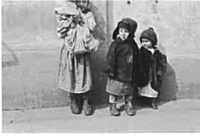
70. В Могильові. Фото ГРГ “Остланд” (Вальтер), березень 1943 р. ЦДАВО України, ф. 3676, оп. 1, спр. 139, арк. 18, п. 27.