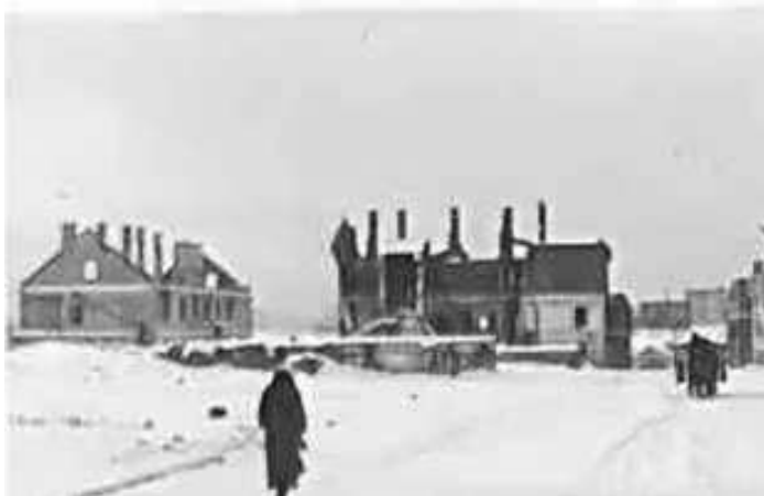
111. Мінськ, на Коммандантурштрассе (Kommandanturstrasse) (сучасна вул. Карла Маркса). 1 грудня 1942 р. ЦДАВО України, ф. 3676, оп. 1, спр. 139, арк. 2, п. 30.