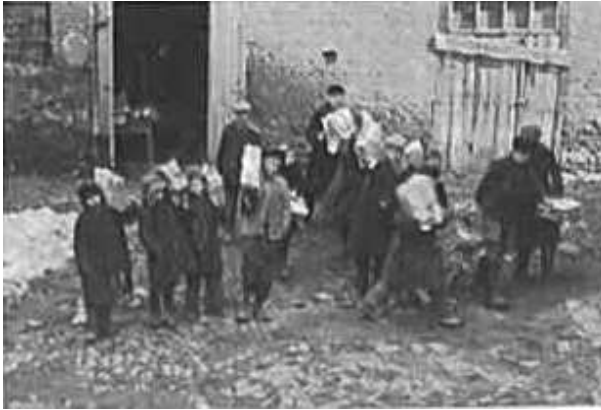
36. Могильов, переміщення книжкових зібрань. Фото ГРГ “Остланд” (Вальтер), березень 1943 р. ЦДАВО України, ф. 3676, оп. 1, спр. 139, арк. 18, п. 25.