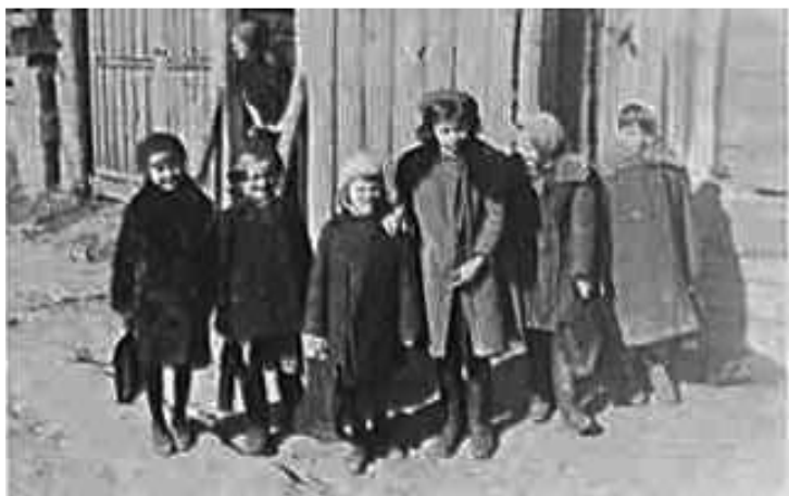
65. Могильов, учні місцевої школи. Фото ГРГ “Остланд” (Майер), лютий–березень 1943 р. ЦДАВО України, ф. 3676, оп. 1, спр. 139, арк. 8, п. 32.