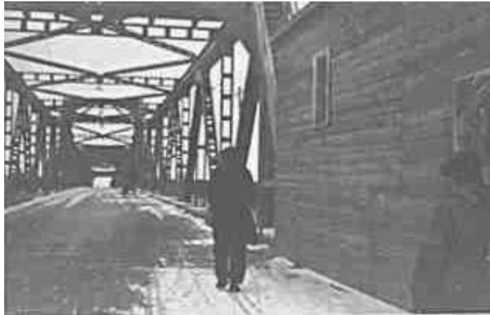
54. Автомобільний міст через р. Західна Двіна (нім.: Dūna, латиськ.: Daugava) поблизу м. Даугавпілс у Латвії (нім.: Dünaburg, латиськ.: Daugavpils). 29–30 листопада 1942 р. ЦДАВО України, ф. 3676, оп. 1, стр. 139, арк. 33, п. 16.