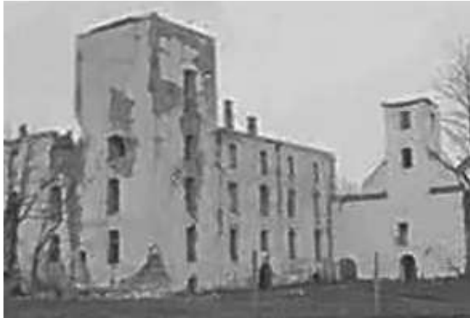
128. Замок Пильтсамаа в Естонії (ест.: Põltsamaa ordulinnus, нім.: Schloss Oberpahlen), зруйнований під час боїв у 1941 р. Фото ГРГ "Остланд" (О. Нерлінг), 25–28 жовтня 1942 р. ЦДАВО України, ф. 3676, оп. 1, спр. 139, арк. 14, п. 35 а.