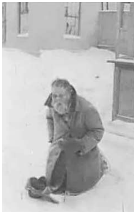
61. В Могильові. січень 1943 р. ЦДАВО України, ф. 3676, оп. 1, стр. 139, арк. 33, п. 16.