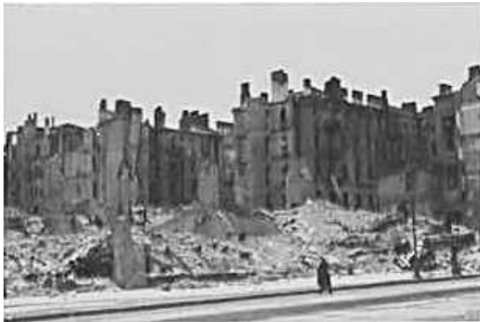
91. Київ, Хрещатик. Фото ГРГ “Остланд” ([О. Нерлінг]), 6–12 листопада 1942 р.

ЦДАВО України, ф. 3676, оп. 1, спр. 139, арк. 20, п. 14.