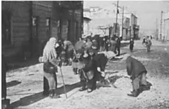
75. Могильов, очищення вулиць від льоду. березень 1943 р. ЦДАВО України, ф. 3676, оп. 1, стр. 139, арк. 76, п. 29.