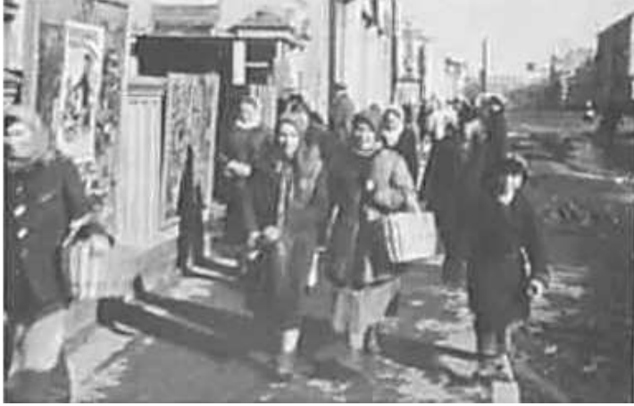
74. Могильов, жінки в базарний день. Фото ГРГ "Остланд" (Вальтер), березень 1943 р. ЦДАВО України, ф. 3676, оп. 1, стр. 139, арк. 76, п. 22.