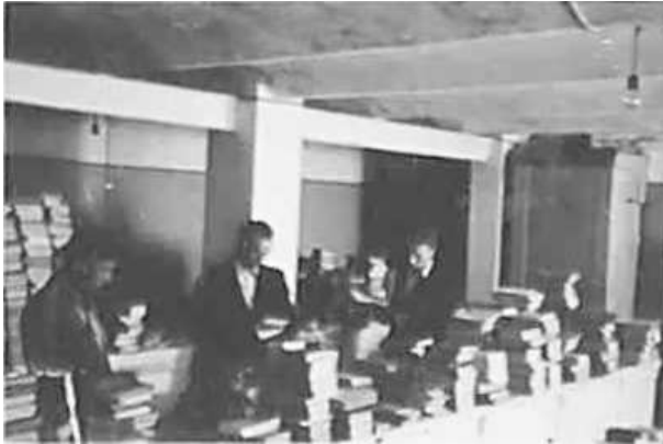
48. Сортування книжкових зібрань конфіскованих Оперативним штабом. Рига, серпень 1942 р.

ЦДАВО України, ф. 3676, оп. 1, спр. 139, арк. 82, п. 39.