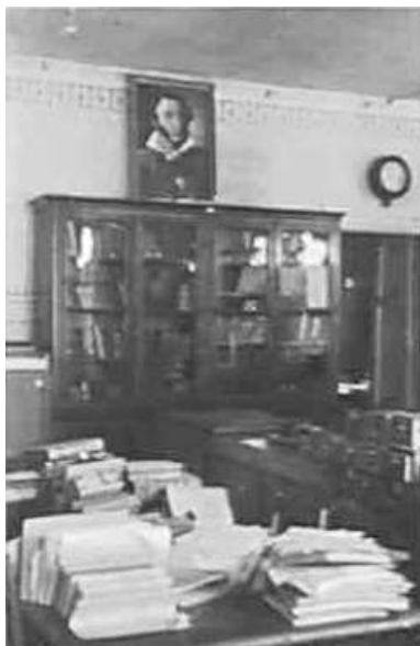
34. Могильов, робоче приміщення бібліотекарів у 1-й міській бібліотеці.

січень 1943 р.