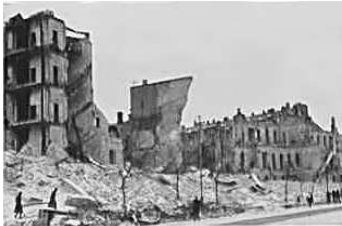
93. Київ, Хрещатик. Фото ГРГ “Остланд” ([О. Нерлінг]), 6–12 листопада 1942 р. ЦДАВО України, ф. 3676, оп. 1, спр. 139, арк. 20, п. 20.