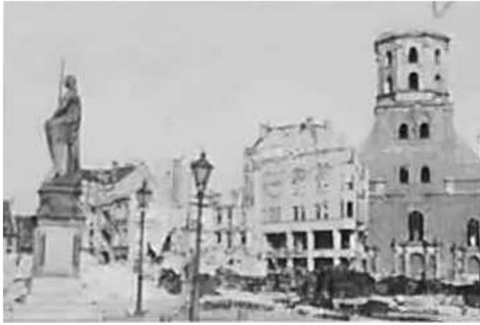
126. Рига, Ратушна площа (зліва – статуя Роланда, справа – пошкоджений собор Св. Петра). Фото ГРГ “Остланд”, серпень 1942 р. ЦДАВО України, ф. 3676, оп. 1, спр. 139, арк. 26, п. 29 а.