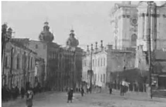
101. Київ, Андріївський узвіз. листопад 1942 р. ЦДАВО України, ф. 3676, оп. 1, спр. 139, арк. 31, п. 28.