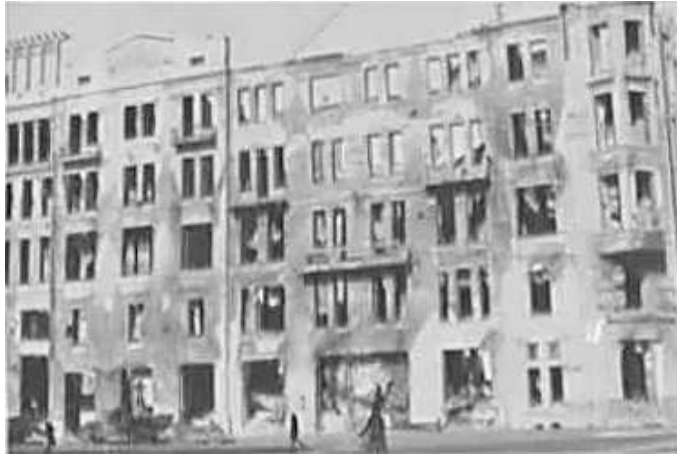
110. Харків, на вул. Сумській. Фото ГРГ “Остланд” ([О. Нерлінг]), 6–12 листопада 1942 р. ЦДАВО України, ф. 3676, оп. 1, спр. 139, арк. 24, п. 25.