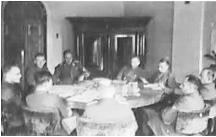
8. Засідання керівників підрозділів Оперативного штабу з питань окупованих східних територій, що відбулося у листопаді 1942 р. у Києві та Харкові. Київ, [6–12 листопада 1942 р.]

ЦДАВО України, ф. 3676, оп. 1, спр. 139, арк. 35, п. 37.