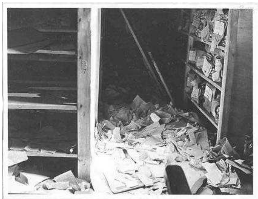
7. У приміщенні архівосховища Статистичного управління УРСР. Київ, вул. Короленка, 24, липень 1942. Фото Управління штабу (Краус).

ЦДАВО України, ф. 3206, оп. 5, спр. 1, арк. 215.