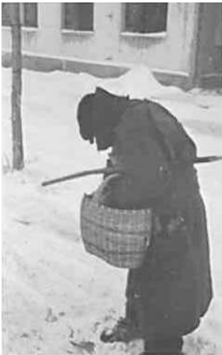
60. В Могильові. Фото ГРГ “Остланд” (Майєр), січень 1943 р. ЦДАВО України, ф. 3676, оп. 1, стр. 139, арк. 33, п. 9.