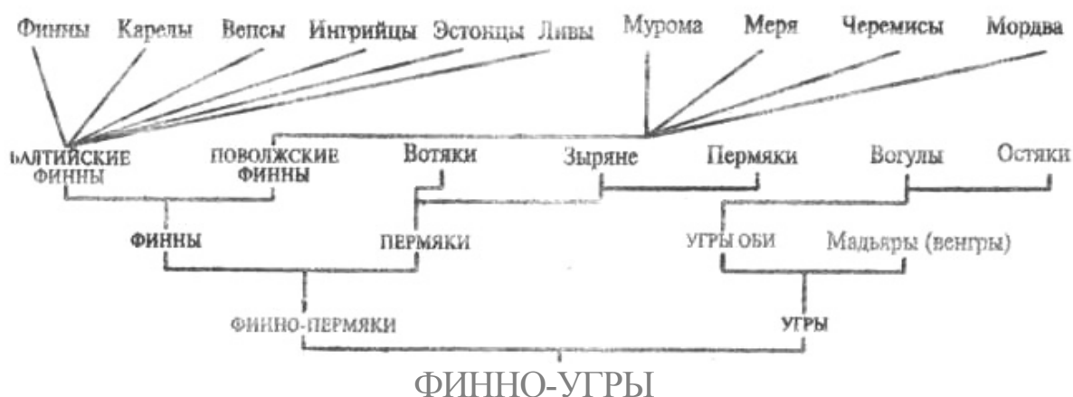
Лингвистические взаимосвязи финно-угров. По Kajava, Y., EA №8, №9, 1922, pp.353–358.

Приводим таблицу, раскрывающую взаимосвязи этих народностей.