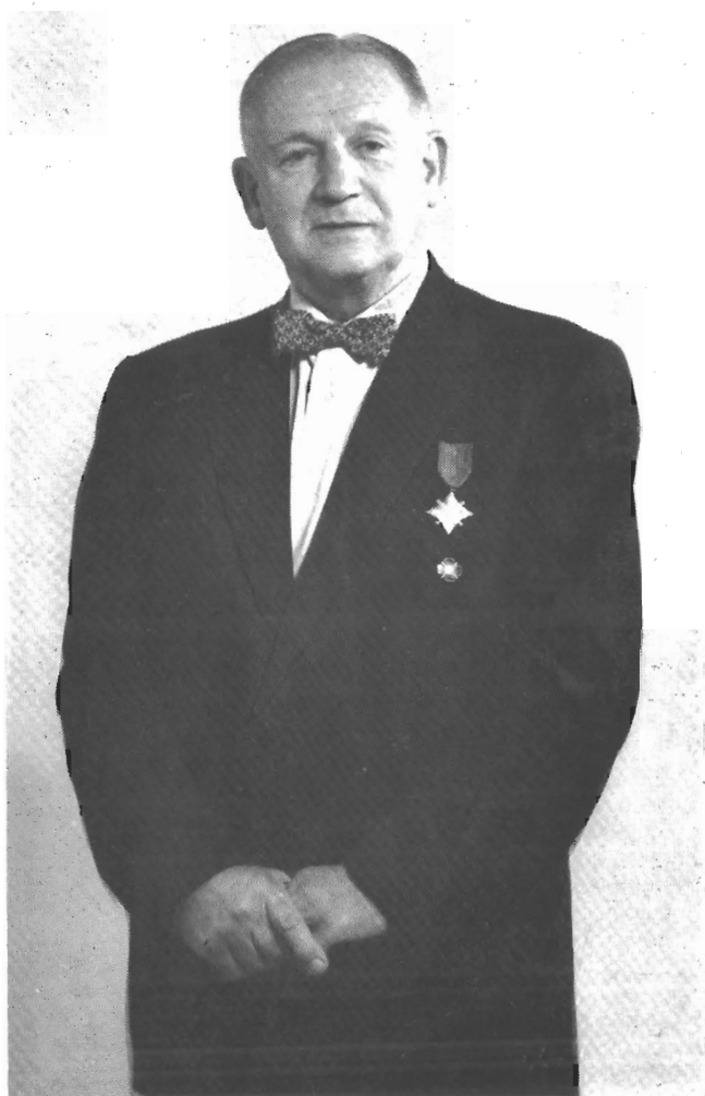
Автор — Майор Української Армії Семен Левченко