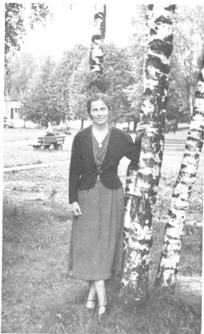
Гетьманівна Єлисавета Скоропадська — Кужім Оберстдорф