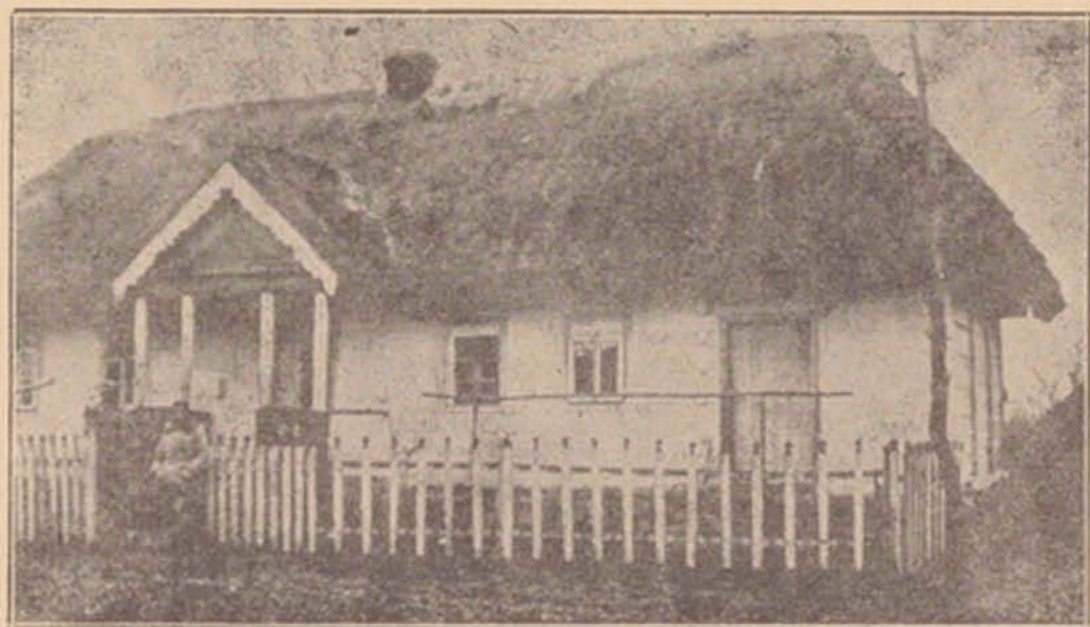
Хата першого українця переселенця в Канаді.

Прийміть же оту книгу до своїх рук, читайте її уважно, не пропустіть нічого. Приглядайтесь до знімок людей, на-