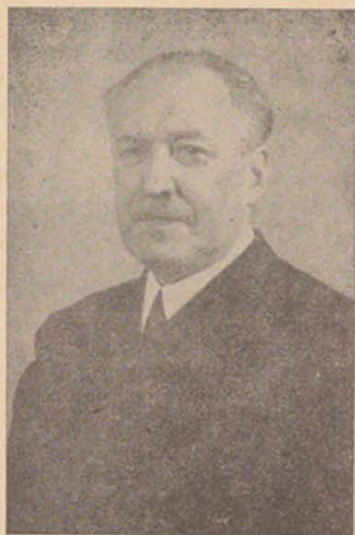
Проф. Дмитро Дорошенко.

Нині ми святкуємо свято з нагоди появи “ПРОПАМ'ЯТНОЇ КНИГИ”, котру видав своїм старанням і великим коштом Український Народний Дім у Вінніпегу.