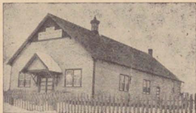
Народний Дім в Овкборн, Ман.

„Пропам'ятна Книга” це не повість, ні навіть не історія, більшість її статей писана таки не письменниками, не журналістами, а самими робітниками, тими піонерами, що цеголку до цеголки складали, що після цілоденної тяжкої праці на хліб насущний ішли копати фундаменти, носити дошки, двигати вгору ту величаву будову українського духового життя на чужині. „Пропам'ятна Книга” — і може саме й у тім її найбільша вартість — це майже хроніка, велична хроніка невсипущого труду, мозольних змагань з прерізними перешкодами, це хроніка життя великої частини українського народу, який хоч і на тисячі миль закинений від Рідного Краю,