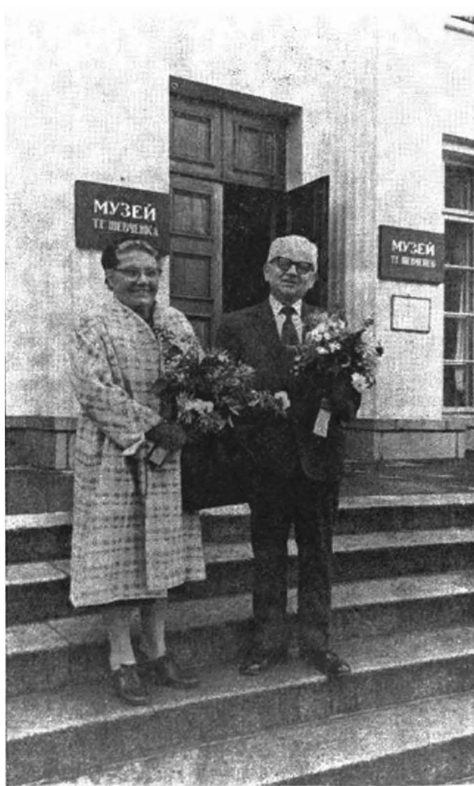
Після оглядин Музею