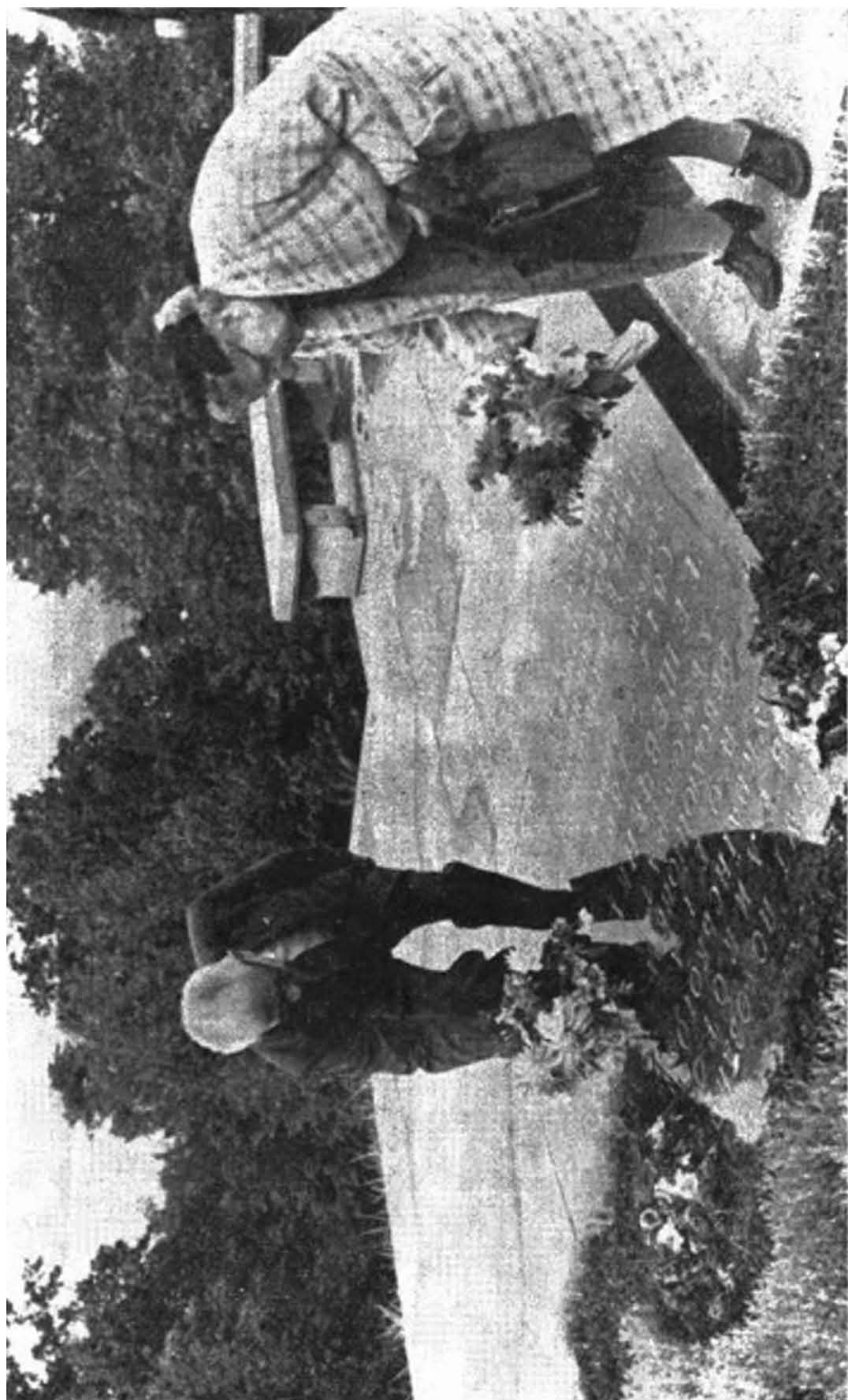
Зложення квітів на могилу Т. Г. Шевченка